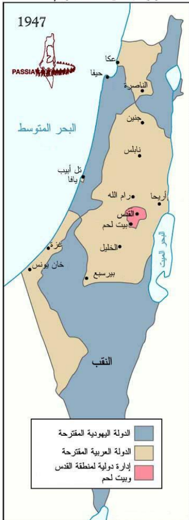
خطة الأمم المتحدة لتقسيم فلسطين قرار الجمعية العامة رقم 181

امتنتعت بريطانيا عن التصويت على قرار التقسيم ١٨١ الصادر في ٢٩/١١/١٩٤٧م إلا أن الدول التابعة لها ، والدول التي تربطها بها