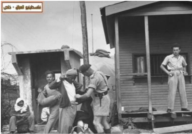
الهاغانا تفتش عربا

وهنا لابد من الإشارة إلى أن جميع رؤساء الحكومات الصهيونية حتى الأمس القريب هم إما رؤساء أو أعضاء في عصابات صهيونية شاركت في مجازر صهيونية بحق الشعب الفلسطيني فبيغن كان القائد الأعلى لعصابة الأرغون ، ومثله إسحاق شامير الذي شارك في مجزرة دير ياسين وتفجير فندق الملك داوود، وكان قائدا لعصابة شتيرن ، وإسحاق رابين الذي اشترك في مجزرة اللد والرملة في ١٩٤٨/١١/١١ م وأرييل شارون الذي التحق بعصابة الهاغاناة منذ أن كان في الرابع عشر من عمره (٦٩) .