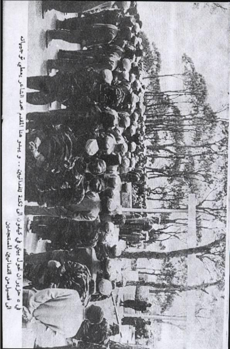
في ه حزين ان تحول بيتي في كيهون الى كلكة للبدائينين .. و بينو هنا المقدم حمد الشاسر يعطى توجوهات الى فصل من البدائين المستجدين