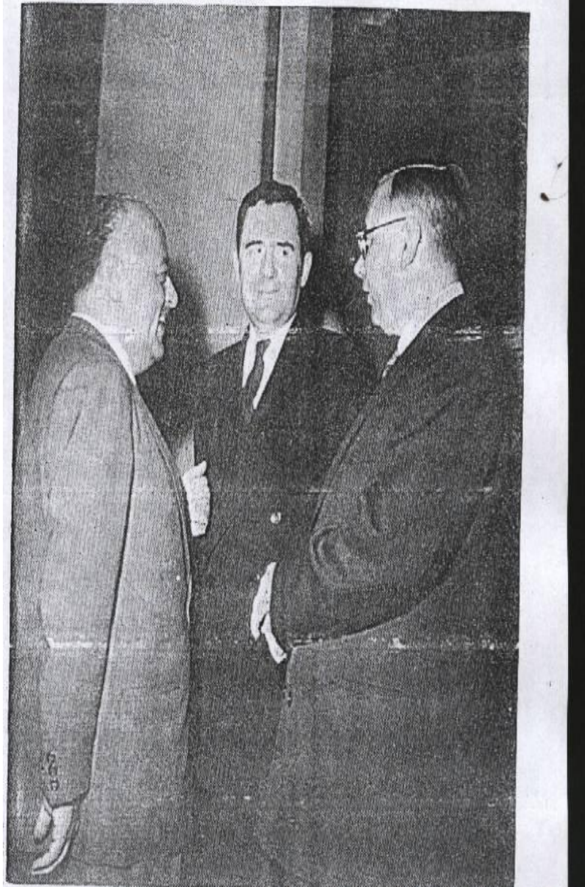
مع جروميكو وير خارجية الاتحاد السوفيتي